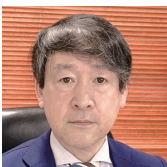
滋賀県老人福祉施設協議会 会長