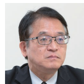
関西大学 名誉教授