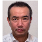
滋賀県立精神保健 福祉センター 所長