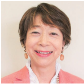
同志社大学 名誉教授