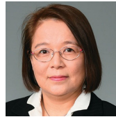
大阪大学大学院 教授