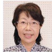
社会福祉法人 万松会 延命こども園 元園長