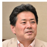
日本福祉大学 学長