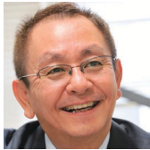
ふくしと教育の実践研究所 SOLA 主宰