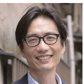
東京大学 特任教授