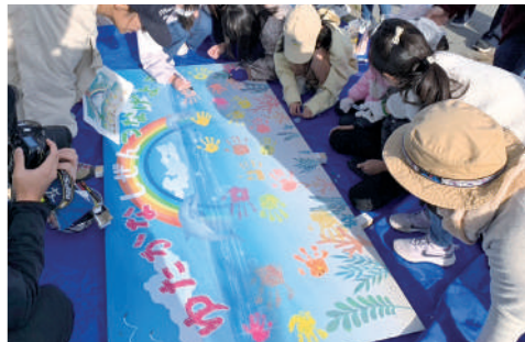
勿来まちづくりサポートセンター