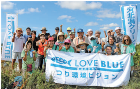
河北潟クリーン作戦実行委員会