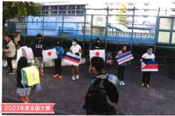
2023年度全国大賞 国籍を超えて笑顔で結びつなげよう南吉田 横浜市立南吉田小学校