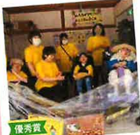
優秀賞 「にのに商店」 ～笑顔は続くよどこまでも～