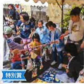
特別賞 練馬の街を練馬のこども達で 元気にしたい!