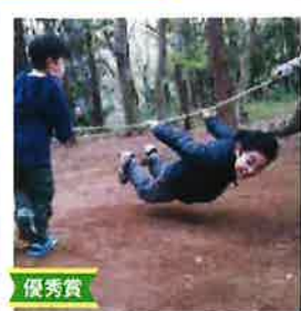
優秀賞 遊んで育つ! ここが動くみんなの居場所