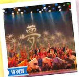
特別賞 異年齢で学び・紡ぎ・創る 「感動舞台」!