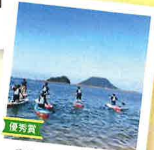
優秀賞 高校生の「OOLしたい」を 応援する事業