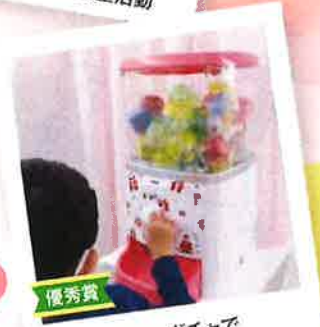
優秀賞 ガチャガチャで ワクワクする時間を届けたい