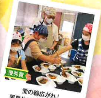
優秀賞 愛の輪広がれ! 置農生の子ども食堂活動