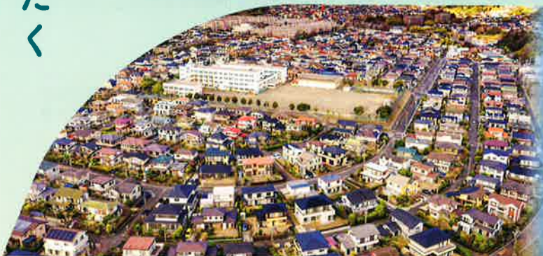
2023年度 住まいのまちなみ優秀賞(上郷ネオポリス自治会)(神奈川県横浜市区)