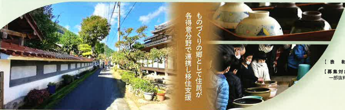
2023年度 住まいのまちなみ賞(一般社団法人 西郷工芸の郷あまんじゃく)(鳥取県鳥取市)

※受賞団体には、30万円(1団体1年あたりを 3年間、維持管理活動の推進の ために支援します)