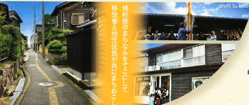
2023年度 住まいのまちなみ賞(特定非営利活動法人 たけのこぞく)(兵庫県豊岡市)