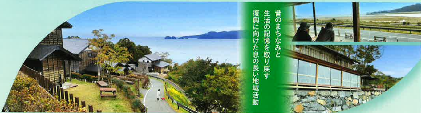
2023年度 国土交通大臣賞(特定非営利活動法人 りあすの森)(宮城県石巻市)