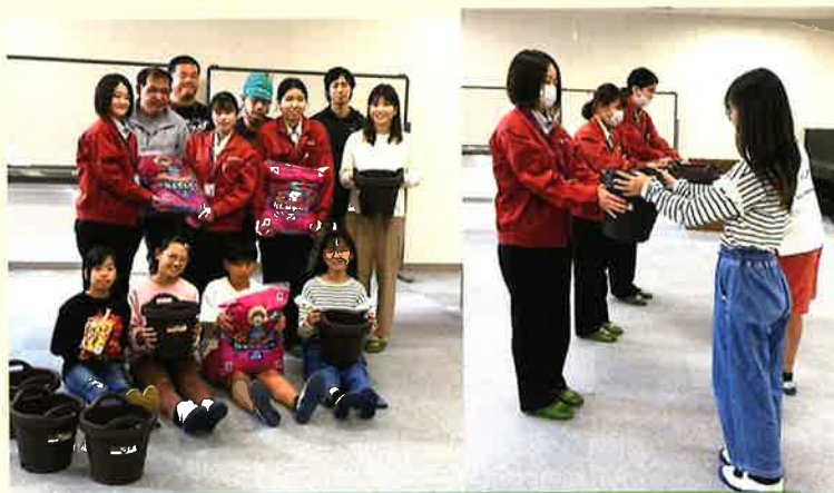
2023年10月30日(月) プランター贈呈式の様子（野洲小学校にて）