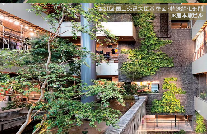
第21回 国土交通大臣賞 壁面・特殊緑化部門 JR熊本駅ビル