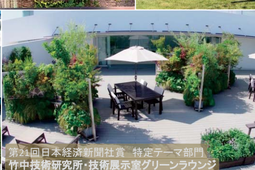
第21回 日本経済新聞社賞 特定テーマ部門 竹中技術研究所・技術展示室グリーンラウンジ