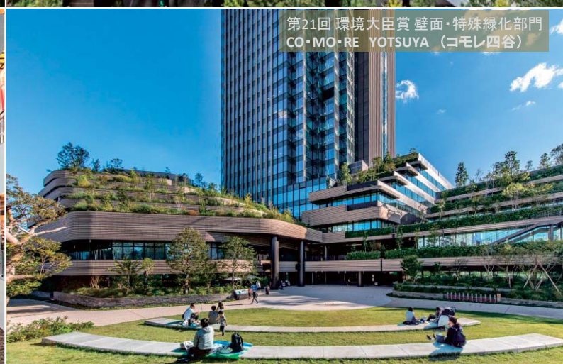
第21回 環境大臣賞 壁面・特殊緑化部門 CO・MO・RE YOTSUYA (コモレ四谷)