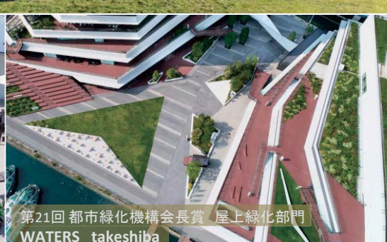
第21回 都市緑化機構会長賞 屋上緑化部門 WATERS takeshiba