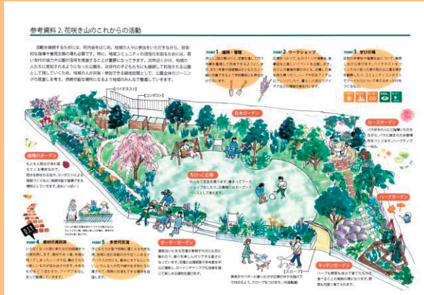
第33回 国土交通大臣賞 花咲き山のポケット・ガーデン

日常的な花や緑の活動を通して、地域の活性化や子どもたちへの情操教育、身近な環境の改善に寄与するプランを募集します。