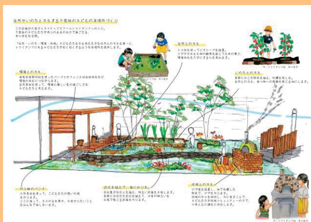
第33回 第一生命財団賞 一般社団法人異才ネットワークのコミュニティガーデン