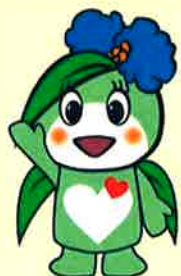
草津市杜協キャラクター ふくちゃん

有料駐車場・駐輪場が隣接していますが、混雑が予想されますので、できる限り乗り合わせか、公共交通機関をご利用ください。