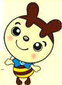
事業団マスコットキャラクター まち活マッチ