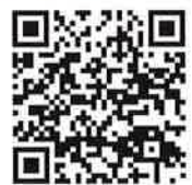
フードドライブせいらん LINE QRコード