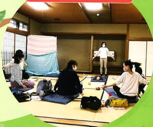
ピアリンクinえひめ (愛媛県)