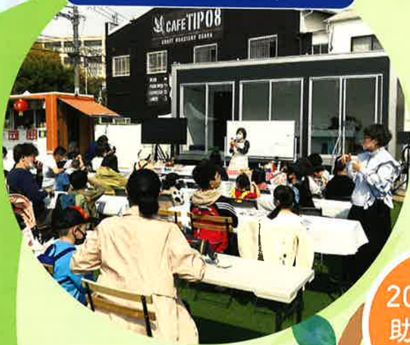
ママコミュ!ドットコム (大阪府)