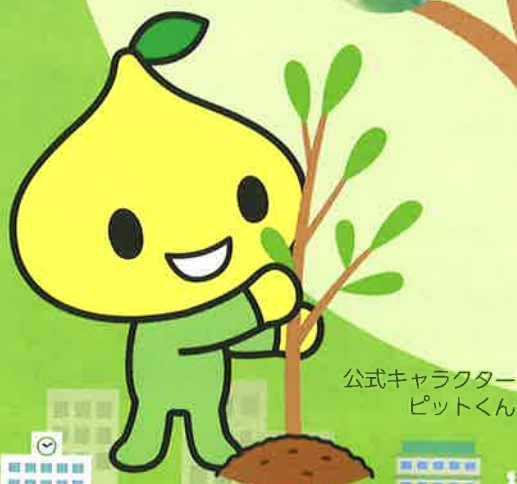
公式キャラクター ピットくん