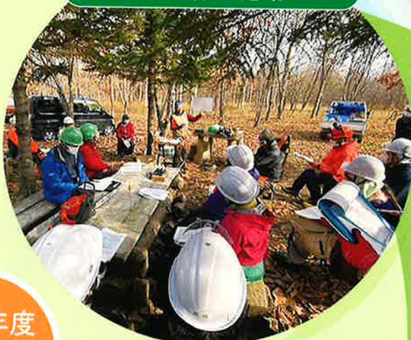
帯広の森 サポーターの会 (北海道)