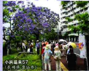
小浜温泉57 (長崎県 雲仙市)