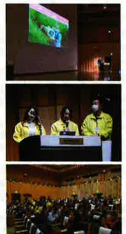
受賞記念発表会の様子

国土交通省 総合政策局 公共事業企画調整課 TEL：03-5253-8912 東京都千代田区霞が関2-1-3