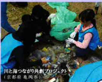
川と海つながり共創プロジェクト (京都府 亀岡市)