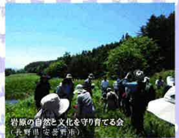
岩原の自然と文化を守り育てる会 (長野県 安曇野市)