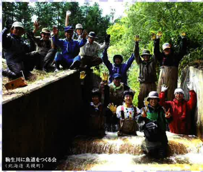
駒生川に魚道をつくる会 (北海道 美幌町)