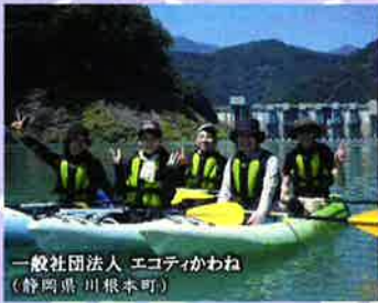
一般社団法人 エコティかわね (静岡県 川根本町)