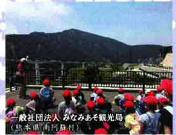
一般社団法人 みなみあそ観光局 (熊本県 南阿蘇村)