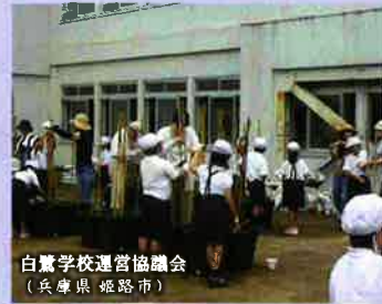
白鷺学校運営協議会 (兵庫県 姫路市)