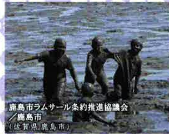
鹿島市ラムサール条約推進協議会 ／鹿島市 (佐賀県 鹿島市)