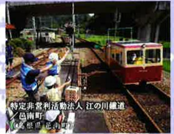
特定非営利活動法人 江の川鐵道 ／昌南町 (岐阜県 恵那市)