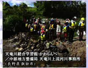
天竜川総合学習館 かわらんべ ／中部地方整備局 天竜川上流河川事務所 (長野県 飯田市)