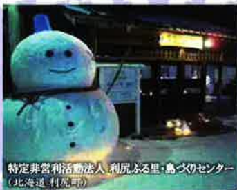
特定非営利活動法人 利尻ふる里・島づくりセンター (北海道 利尻町)