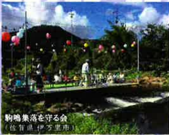
駒嶋集落を守る会 (佐賀県 伊万里市)