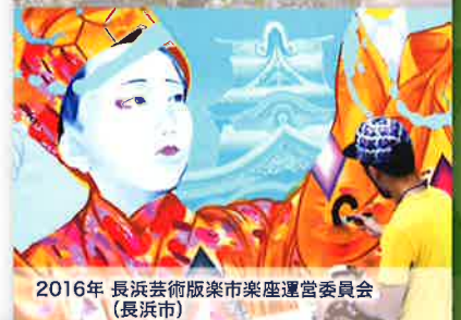
2016年 長浜芸術版楽市楽座運営委員会 (長浜市)