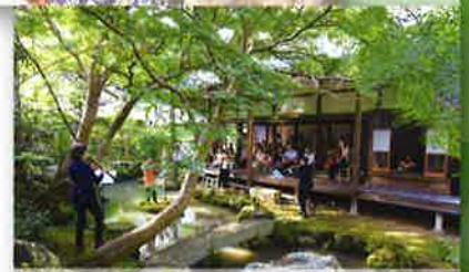
2017年 元・正蔵坊と古庭園を楽しみ守る会 (ながらの座・座) (大津市)