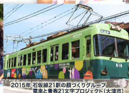
2015年 石坂線21駅の頭づくりグループ 電車と青春21文字プロジェクト (大津市)