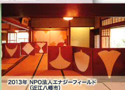
2013年 NPO法人エネルギーフィールド (近江八幡市)