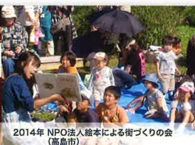
2014年 NPO法人絵本による街づくりの会 (高島市)