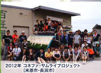
2012年 コネファ・サムライブロジェクト (米原市・長浜市)