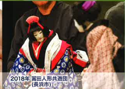
2018年 富田人形共遊団 (長浜市)