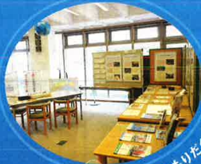
パネル展示ももりだくさん!