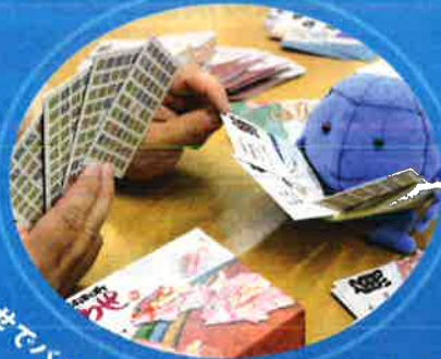
とこ魚あわせてパズルに挑戦!