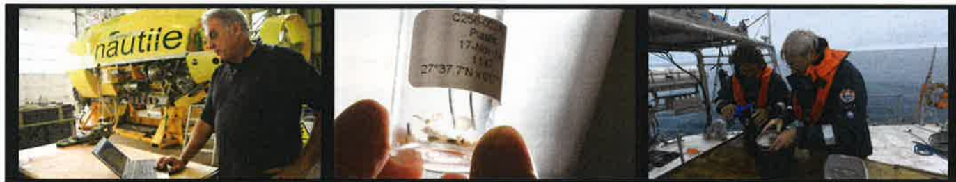
グリーンイメージ国際環境映像祭「海—消えたプラスチックの謎 Oceans: The Mystery of the Missing Plastic」 監督：ヴァンサン・ペラジョ