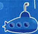
みんなで遊びに来てね