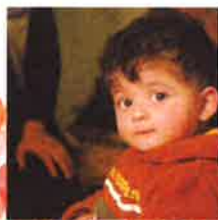
日本国際ボランティア センター パレスチナ・子どもの 栄養失調予防改善事業

本事業については、大津市市民活動センター のHPまたはFACEBOOKをご覧ください