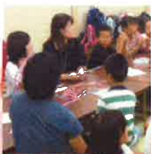
大津夜まわりの会 2020夏休み子どもひま わりの家事業