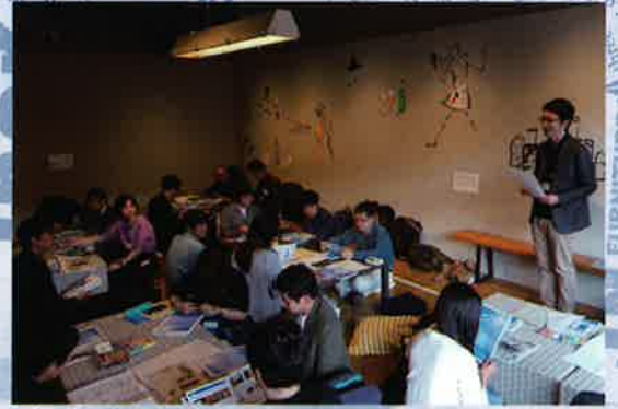
「びわ湖の未来を一緒に考える仲間、大募集！」(3/24@大津)