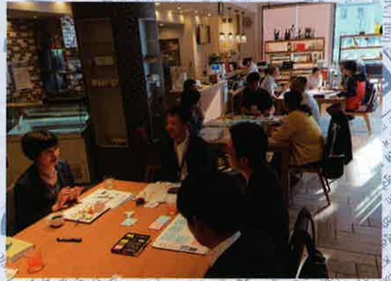
「びわ湖の未来を一緒に考える仲間、大募集！」(5/12@長浜)

これから先、私たちはびわ湖にどう向き合い、守り、支えていけばよいのでしょうか。次の新たな形を模索していかなければなりません。