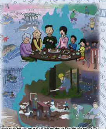
2050年頃のびわ湖のあるべき姿のイメージ (マザーレイク21計画 第2期改定版より)

「びわ湖なう！」のコーナーでは、「マザーレイク21計画」にもとづく過去20年間の取り組み経過やびわ湖の変化の様子などが、データとともに詳しく解説される予定です。