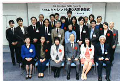
※第6回表彰式風景写真