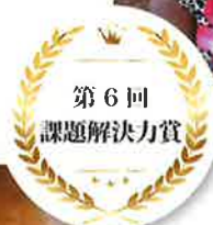
フードバンク山梨 (山梨県南アルプス市)

両親または片親をエイズで亡くした18歳未満の子ども＝エイズ孤児問題の解決に向けて、ケニアとウガンダで活動。エイズ孤児が自らの未来を前向きに切り拓ける社会の実現を目指している。