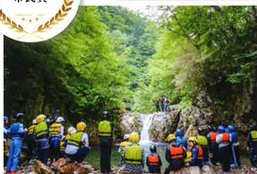
みらいの森 (東京都港区)

児童養護施設で暮らす子どもたちが平等に活躍する機会を得られる社会の実現を目指す。アウトドア活動を通じて生涯の糧となる体験の創出や、幸せで爽やかな成長のサポートを行う。