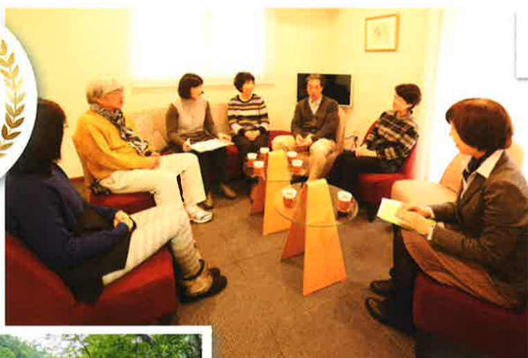
がんサポートコミュニティー (東京都港区)

がん患者とその家族のために臨床心理士やソーシャルワーカー、看護師といった専門家による心理社会的なサポートを提供。世界最大のがん患者支援非営利団体Cancer Support Communityの日本支部として2001年に設立された。