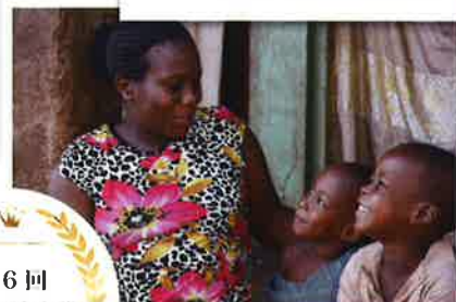
エイズ孤児支援NGO ・ PLAS (東京都台東区)

両親または片親をエイズで亡くした18歳未満の子ども＝エイズ孤児問題の解決に向けて、ケニアとウガンダで活動。エイズ孤児が自らの未来を前向きに切り拓ける社会の実現を目指している。