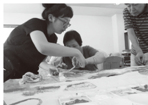
▲メンバーと一緒にイベント用旗づくり

※1 地域で暮らしている障がい者の方たちの造形活動の場を派遣し、絵画や粘土などの造形活動を支援する事業 ※2 施設利用者