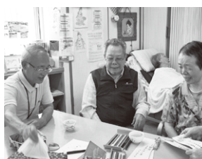
▲利用者さんと談話

しています。対外的なことだけではなく、昨年度は団体内での情報共有を目的に各事業毎の年間活動実績一覧表を作成し総会で配布したところ、「活動の全体像がよくわかる」と喜ばれました。また、職員同士交流ができることが情報共有の第一歩と考え、約七十名の職員全員が他の職員を分かるようになるために、職員全員の顔写真と名前を記載したものを本部事務所内の壁に貼るようになりました。