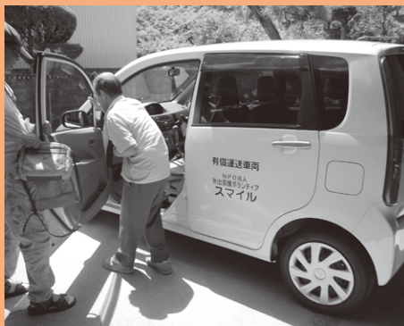
▲ドアからドアへ送迎。地域住民で行う移動支援