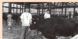
▲のびのびと放牧で育つから気性も穏やかな近江牛・母牛さんと。(木下牧場にて)

フェスとの連携でイナズマロックカレーやカレーパンを企画販売、今年は草津メロンを使った商品づくりにも取り組みます。