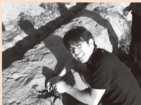
▲滋賀の大地でアスパラがとれるんです。

「地産地消商品を作ろうと思ったきっかけは、営業先で『滋賀って何が名物なの?』と聞かれ、改めて何だろうと考えたが、すぐには思いつかなかったことです。この質問に触発され、無いなら自分でつくり滋賀県に来た人達に滋賀の旬のものを味わってもらい、滋賀の事をもっと知ってもらおうと、滋賀県産の物を使った地産地消商品づくりを始めました。