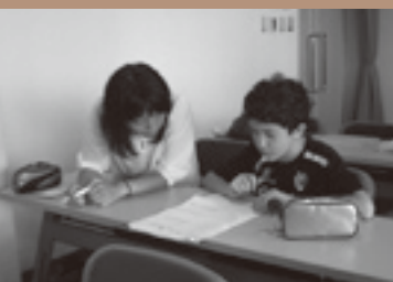
▲学習風景。1対1。真剣なまなざしに圧倒されます。双方の熱い想いが、こころに響いてきます。