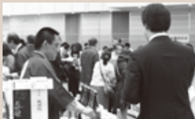
▲地酒振興を目的にイベントにも積極的に参加されている

お酒は大手流通業者が低コストで販売される時代のなか、エスサーフは滋賀の地酒にこだわり多くの種類をそろえているので、県内の小売店やスーパーから滋賀の地酒に関しては多くの信頼を寄せています。創業の江戸時代末期から受け継がれている滋賀の地酒振興への思いとして「私たちはこれまでつちかってきたお酒