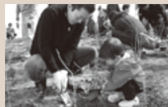
▲家族の参加もある植樹活動の様子