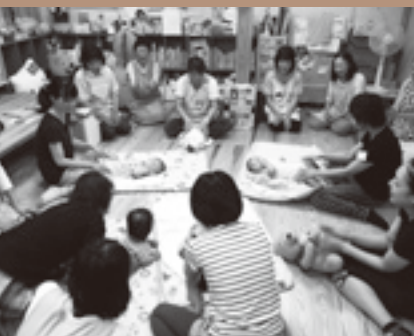
▲全6回で定員7組の「0歳児親子教室」。 タッチケアで“五感で感じる育児”を 実践