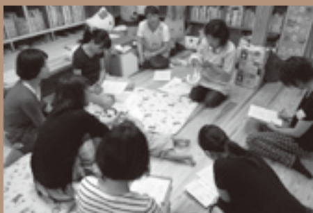
▲歯の成長、歯ブラシ選びやみがき方などについて歯科衛生士から説明を聞き、疑問をぶつける。

「母親の不安を分析した結果、育児に対する未経験の不安と、一人の女性としての見通しが持てないことへの不安を抱えていることがわかったので、育児を通して女性が自分の