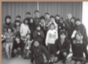
▲全員集合！スタッフと生徒の皆さんです。まさにワールド。国籍を超えた笑顔に、真の“多文化共生”が見えてきます。