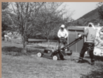
▲野洲市の公園「さくら緑地」の管理作業の様子。掛樋の名所となり、毎年多くの人が訪れている

三上山の麓に約40年前にできた近江富士団地の住民有志で構成されています。かつて宅地開発で失われた花や緑を取り戻そうと1994年、当時働き盛りだった