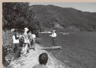
▲地域を肌で感じながら地域活動の実践者と直接意見をかわす塾生達

地域の具体的な問題をテーマにグループをつくり、調査を行い、活動や展望を検討し、地域での実践を通して学びます。