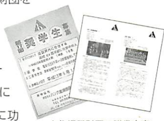
文化振興財団の贈賞内容を詳しく紹介した冊子を毎年発行。今年は第18回奨学生を募集します。

設立。昨年までの贈賞数は個人33名、94団体に達し、その受賞分野も学術研究・文化活動・スポーツ・福祉さらには環境保全など多岐にわたっています。毎年、社会文化に功績・功労のあった隠れた個人や団体が、各団体の推薦を受け、県内の有識者で構成