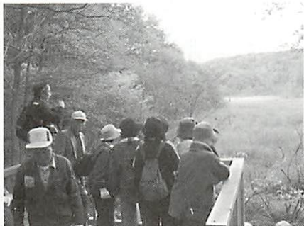
●「素晴らしい自然を知ってみたい」との思いから、自然観察会も開かれています。

毎月1回開催されている「里山自然観察会」には、森を見ようと地元の中学生をはじめ、遠くは京都・大阪から多くの人たちが集まります。この案内で森を訪れた人は2000人にもほります。また、定期的にパトロールをして森を守っています。こうした活動