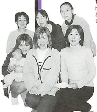
●広報や小道具、舞台構成など、裏で支えるスタッフの皆さん。