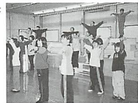
●本番を2日後に控えた稽古場での練習風景。

歌やダンスのレッスン指導を受けるだけでなく、みんなで力を合わせて舞台装置や衣装、かぶりものまで、自分たちで作るといふから素晴らしい。幅広い技術が必要とする舞台芸術を通じて培った成果はとて大きいものです。稽古場のホールに大きな歌声が響き、ダンスが始まります。子どもたちが手をつなぎ、輪を描いて元気に踊ります。その伸びた手の先は、まるで未来の明るい世界を指差しているようです。これまで6作のミュージカルを上演し、宝塚ミュージカルコンクール銀賞、銅賞受賞と、評価を受けてきました。