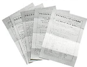
●「びわこネイチャーゲームの会通信」年6回発行。

その辻田さんとネイチャーゲームの出会い、自分ができる自然保護は何かを考えたことからだと言います。環境問題を考えた時に、知識から入るの