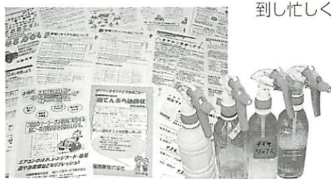
リサイクルや時事ネタなど毎月ミニコミ紙を発行。

「3年ほど前から地域や家庭、行政で環境保全活動が盛んになっていました。我が身を振り返ったとき、ガソリンスタンドは対極にあると気づいて愕然としたんです。」以来、何かできるはずと思考錯誤の末、空き缶や牛乳パック、乾電池や廃バッテリーなどあらゆる資源ゴミの回収ステーションにたどり着きました。「ふつう分別ゴミの回収日や回収場所は決まっています。GSなら365日