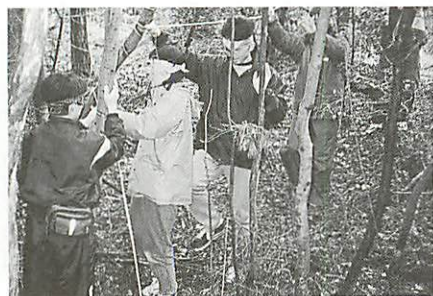
●ネイチャーゲーム「目かくしトレイル」の様子。

昨年はこのネットワークを活用し、6つの市民団体の協力を得て、体験活動のプログラムを学校に提供するという企画に取り組まれました。この実績はまだまだこれからですが、今後、学校教育での体験学習が増加する中、き