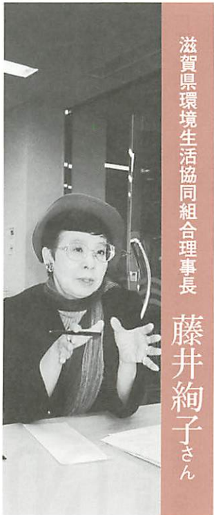
滋賀県環境生活協同組合理事長

各国の環境状況を見聞きすると思います。そこから、市民サイドのより細かな民際外交ができるという交流軸がほしいですね。今、国同士の関係が非常に危ういことになっているので、むしろ、環境を軸に民間が交流することで国際関係が良くなると思います。私たち市民は交流を通じて、自分たちの問題意識がまだ非常に浅いことやもっと専門性を持たないといけないことに気づくだろうし、専門性を持つためにどのようなネットワークをつくらないとダメかも学ばだろうし、そういった様々なことを世界湖沼会議は気づかせる場になると思います。湖沼会議は開くことが目的ではなく、その後、会議から学んだことを地域にどう持ち帰るか、どう語れるか、琵琶湖の周りにどれだけNGOが育っているかが試される場だと思います。琵琶湖の発信力を持ちつつ、相手に学ぶという、そういうものを持つ機会になってほしいと思います。そして、それは参加することではできません。本会議だけでなく、各地域では自由会議が開催されます。それらに参加し、自分も「そうだ、こんなことをやってみよう」ということを探したらどうかと思います。