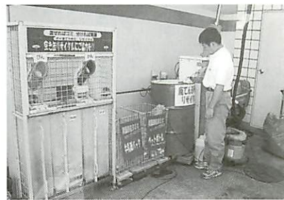
牛乳パックは環境生協へ。アルミ缶は小学校の備品に交換される。

持込が可能でしょ。便利と思ってもらえたのか、主婦の口コミでパツと広がって…資源回収が来店動機になるというおまけも付きました。」資源回収だけでなく、自社で使用する事務用品、用紙、洗剤等についてグリーン購入を進めています。特に天ぷら油の回収は、それを原料に製品化された液体石けんをあらためて購入し、同ガソリンスタンドで洗車機の洗浄剤として利用するなど徹底したこだわりが、資源循環型の実践として高く評価を受けました。