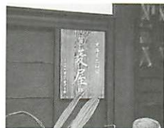
●街道沿いには旅籠のあった場所を表す石碑や屋号の看板が設置されています。

古くから東海道の宿場として栄えてきた甲賀郡土山町で、その歴史ある町並みと文化を保存しようと設立されたのが「土山の町並みを愛する会」です。1990年の発足以来、「住む人が誇りと愛着を持って生きられるような町にしたい」との思いで活動を続け、町並み整備などの事業を通して歴史が伝える文化の伝承に努めています。会はもともと1988年から始まった村おこし事業の一環として旗揚げされ、以後規模を拡大しつつ現在では会員数170名を数えるまでになりました。活動を始めた当初は歴史と文化を見直す事業として旧東海道筋の旅籠を調査、町からの委託により教育委員会の事業を継続する形で旅籠跡に旅籠名を刻んだ石柱を立てる事業を展開したり、また商家跡