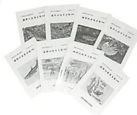
●毎年1回発行の年報「滋賀の食事文化」。会員が足で集めた食情報がぎっしり。

生活の知恵ですね。伝統食は消えつつありますが、栄養面だけでなく文化としても消えてしまうのはとても残念です。「活動10年目のこの春、『食事博』を開催、様々なイベントと滋賀の食事を110点を披露しました。レシピ本も近々発表する予定です。「料理教室など子どもたちが『体験』できる機会を持ちたいですね。」ターゲットは次世代の子どもたちです。(編集ボランテニア 松井由美子)