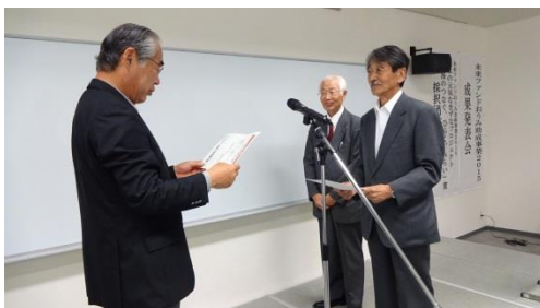
NPO 法人家棟川流域観光船

今年度の授賞団体は、かつて人々が大切にしてきた地域の環境や、人と人のあたたかいふれあいを今も大切にし、長年活動を継続してこられた2団体です。