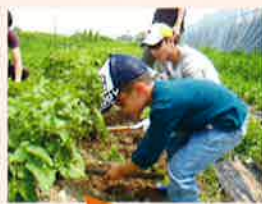
農家にお借わないでね