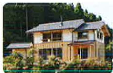
地域の景観に馴染む外観