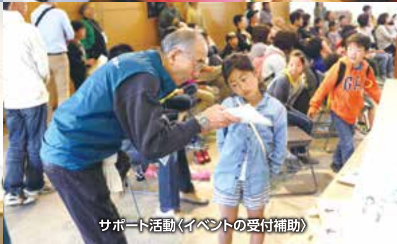
サポート活動〈イベントの受付補助〉