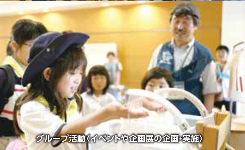
グループ活動〈イベントや企画展の企画・実施〉