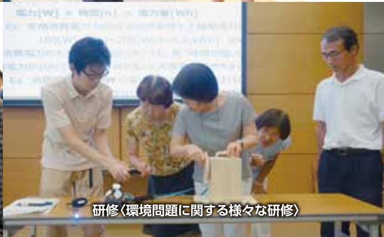
研修〈環境問題に関する様々な研修〉