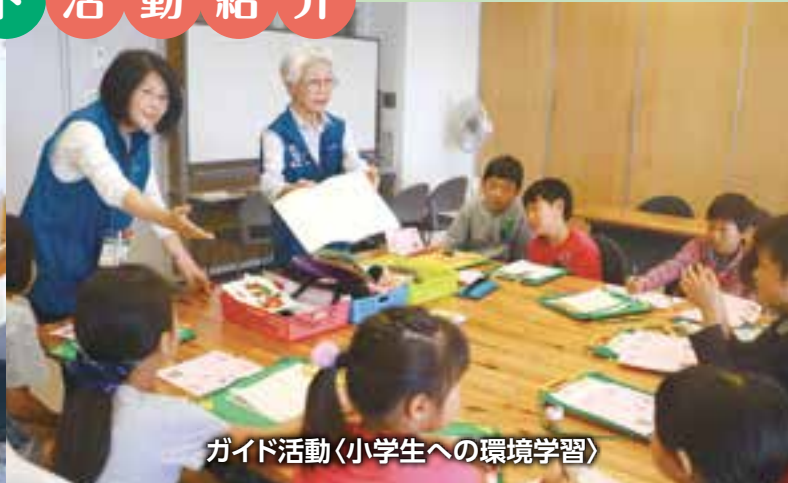
ガイド活動〈小学生への環境学習〉