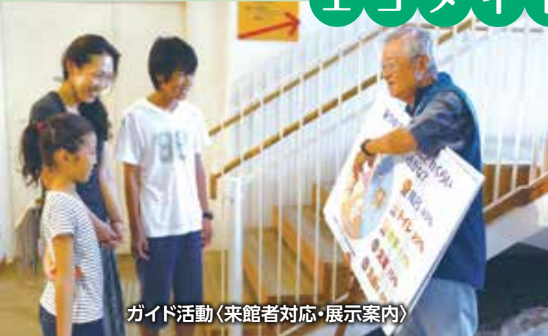
ガイド活動〈来館者対応・展示案内〉