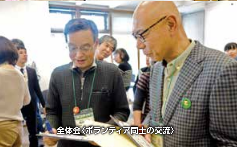
全体会〈ボランティア同士の交流〉