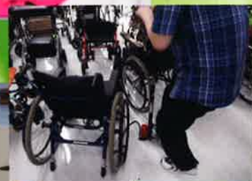
▲福祉用具・車いすメンテナンス作業