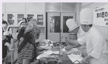
▲「食の匠の食育出張講座」の様子

同社は1971年に創業、売り上げは2008年には200億円を超えました。当時、得意先の調理技能者から自身の技能を教え人材を育てたいが機会がないとの声を聞き、取引のある学校と技能者の属する協会の仲介役となり食に関する講座を開き、社会貢献する企業として食の文化や食産業の発展に寄与しようと活動を開始されました。子ども達には単に調理し食べるだけでなく、この野菜は誰がどのように育て何処から来ているか、この魚は何処で捕れるか等、食に関して様々な角度から関心を持ち想いを馳せて欲しい、また食のマナーも学んでほしい、更にプロの職業人の姿を見ることで食に携わる人材が一人でも多く生まれ食産業の発展に繋がり、世界に通用するプロにまで育ててほしいとの想いがあります。