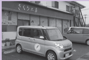
▲日野町に開所した「さくら工房」

発足のきっかけは、滋賀県立小児保健医療センターの療育教室を卒業した自閉症スペクトラム児の親達が、まずは自分達で正しい知識と支援のあり方を学ぼうと一九九六年に勉強会を始めたことでした。その後も親