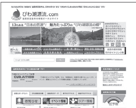
▲ホームページ「びわ湖源流.com」

様々な手法を試すあまり、上手く行かなかった活動もありました。クラウドファンディングREADYFORで支援を募りまし