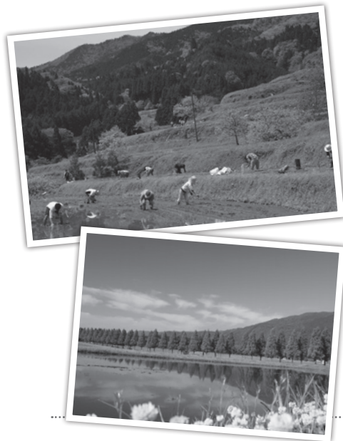
◀日本の棚田百選(畑の棚田・上)と 日本の街路樹百選(メタセコイヤ並木・下)

設立当初からNPOの基礎固めとなる様々な活動資金獲得の「種まき」を、自身の持つ情報技術と准認定ファンドレイザーの知識とを総動員して行い、今まさに少しずつ芽がでて、成長する姿が目に見えるようになってきました。「三年間は、頑張ろう！」と自身に課した目標で、高島市の魅力だけでなくNPOの活動内容を発信し