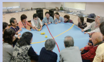
▲いつも最高の盛り上がり「シーツ玉入れ」

50代～80代の参加者はいつもみなさん和気あいあい、笑い声が絶えません。毎回のように参加されている方のほぼ全員の体力測定の数値が改善するという結果になり、参加者と私たち双方の大きな励みになっています。