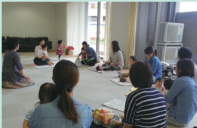
▲お子様講座の様子(五感を刺激し、可能性を引き出すお手伝い!!)

今年度は、2014年度びわこ市民活動応援基金の採択を受け、お子様の育ちのサポートのみならず、母となった女性の支援をすることができました。