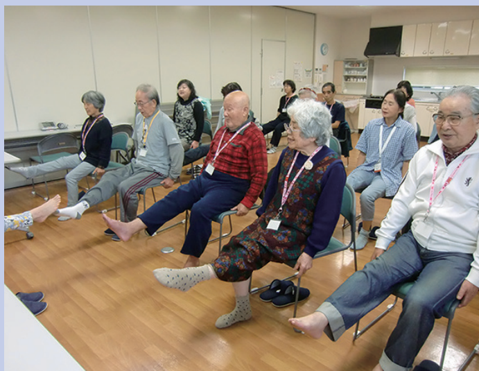
▲筋トレを取り入れて「寝たきり予防」に努めています。

これからも活動を広げ、質を高め、高齢化する地域住民の心身の健康維持に貢献できればと思っています。