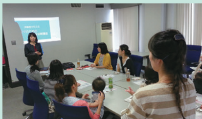
▲それまでのモヤモヤ感の整理が出来た帝王切開講座

コミュニティサロンらんぷは、2010年9月に地域の子育てサロンとして活動をスタートしました。通年の事業としてお子様向け講座とママ向け講座を開催しています。親子で参加できる講座を通じて「共に育つ」子育て支援を行い、様々な経験を通じてお子様の可能性を引き出す機会を提供しています。また、ママ自身が日々を楽しく充実して過ごし、目標をもつことによりイキイキとした笑顔になると家庭が明るくなり、家族にいい影響を与えるのではないかとという視点からママ向け講座を企画しています。