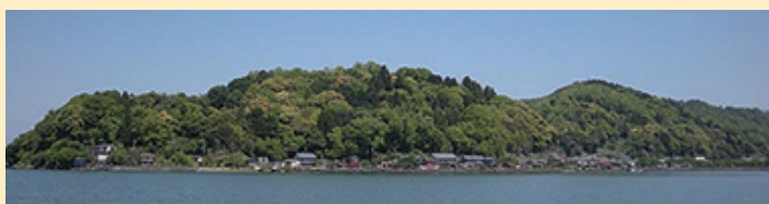
▲湖上に浮かぶ島で人が住んでいる島は非常に珍しく、日本ではもちろん『沖島』だけですが、世界的に見てもわずかしかな貴重な島です。また、さらにその中でも『沖島』は島内に小学校と幼稚園があり、これは世界でも『沖島』だけなのです。