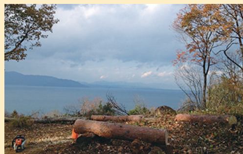
▶整備済みの見晴らし広場。天気が良いと高島方面の景観を楽しめます。