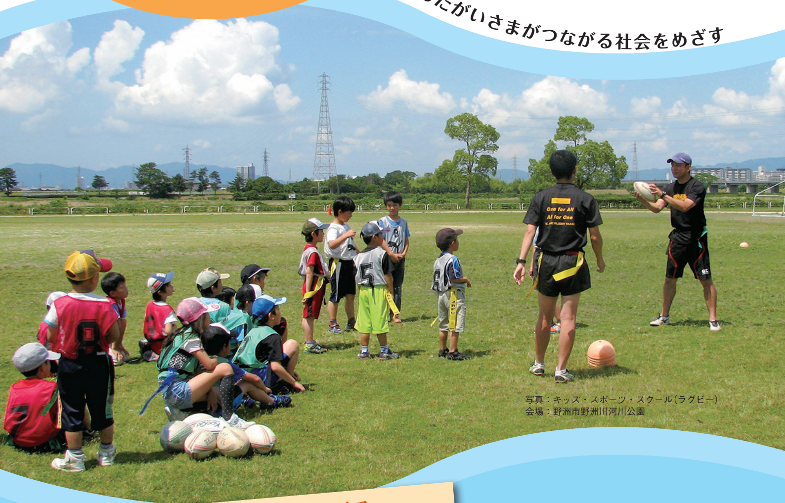
写真：キッズ・スポーツ・スクール(ラグビー) 会場：野洲市野洲川河川公園