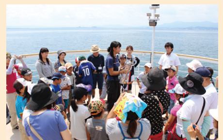
▲湖上での環境学習会

また、弊行が平成4年10月に届出している「公益財団法人関西アーバン銀行緑と水の基金」は、緑化推進や水環境保全に取り組まれる団体の支援や苗木の寄贈等、環境保全活動に取り組んでおり、これまでの事業実績は1億円を超えるなど、弊行とし